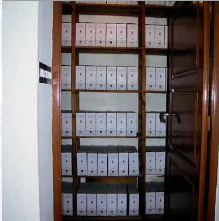
Archivo Municipal de Valverde de Llerena después de elaborar el inventario.