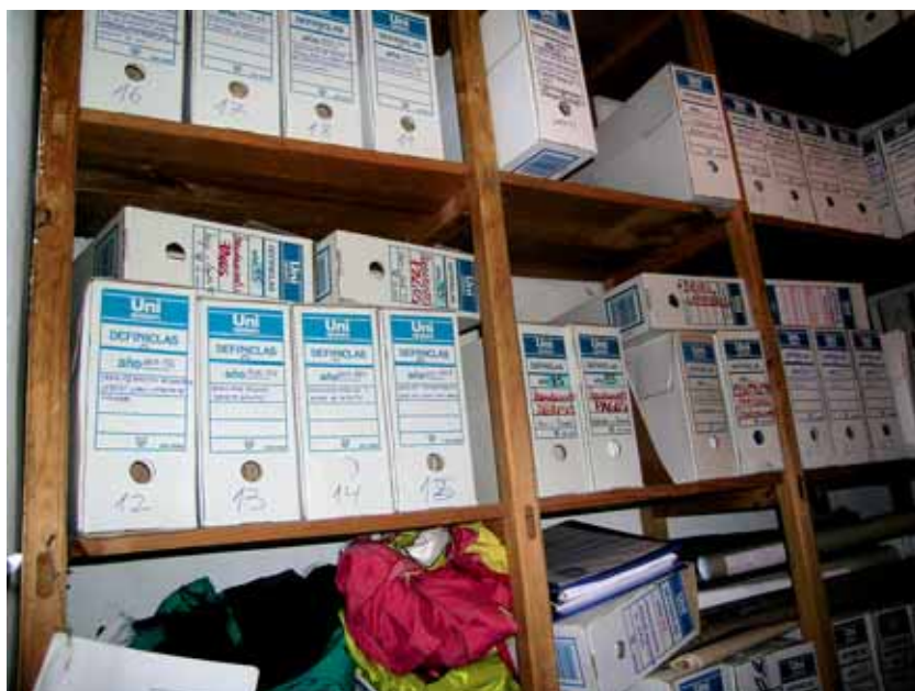
Archivo Municipal de Valverde de Llerena antes de la elaboración del Inventario.