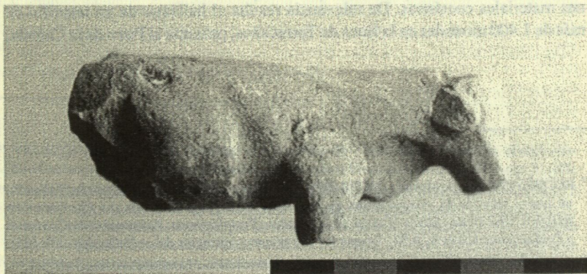
Fig. 2. Vista lateral de la figura