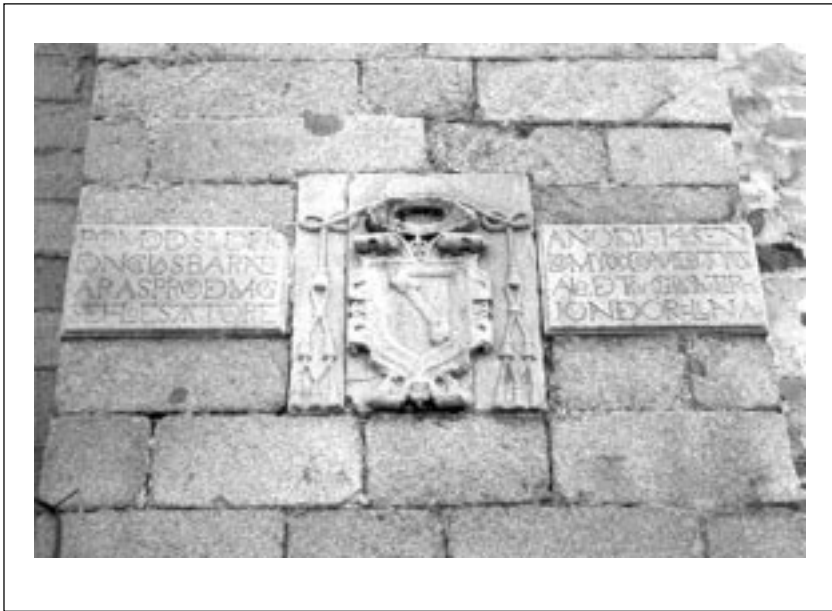
Figura n.º 3. -Inscripción en la torre de la Parroquia de Nuestra Señora de la Asunción