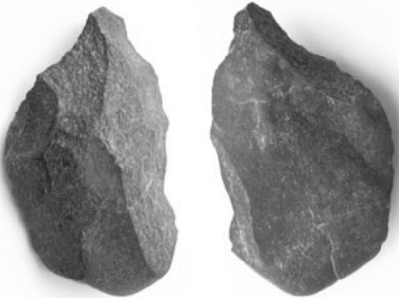
Figura n.º 1.-Bifaz

En los alrededores de Malpartida de la Serena han aparecido una serie de utensilios de piedra tallada (bifaces, raederas, raspadores, hendedores, denticulado...). Estos instrumentos al no haber sido encontrados en un yacimiento