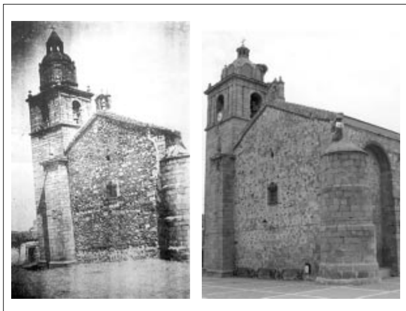
Figura nº4. -Torre de la Parroquia de Nuestra Señora de la Asunción antes de la Guerra Civil (1936-1939) y en la actualidad.