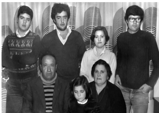
Foto de familia numerosa