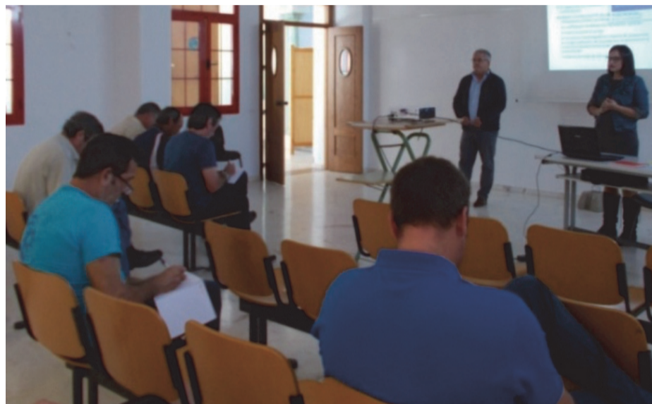
Inauguración del curso llevado a cabo en el Ayuntamiento de Monesterio

La Unidad de Asesoramiento Municipal en prevención de riesgos laborales se ha creado en el marco de un Convenio de colaboración suscrito entre la Federación de Municipios y