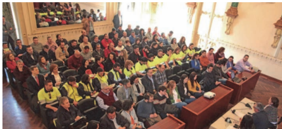
Participantes de las Jornadas

Además de esta jornada, la Diputación de Badajoz organizó durante esta Semana de la Prevención, una jornada de sensibilización sobre el acoso laboral el Salón de Plenos de la