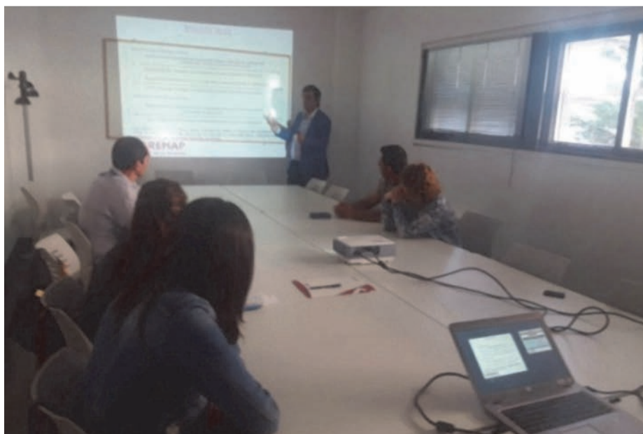
CID de la Mancomunidad de Zafra

El REAL DECRETO 231/2017 de 10 de Marzo, regula el sistema de “BONUS”, incentivo consistente en reducciones de las cotizaciones por contingencias profesionales a las empresas que se distingan por su contribución eficaz y contrastable a la reducción de la siniestralidad laboral . Con el sistema de incentivos Bonus Prevención se puede recuperar el 5% de las cuotas abonadas por contingencias profesionales , y hasta el 10 % de las cuotas si existe inversión por parte de la empresa en alguna de las acciones complementarias de prevención de riesgos laborales recogidas en la declaración responsable sobre actividades preventivas, con el límite máximo del importe de dichas inversiones.