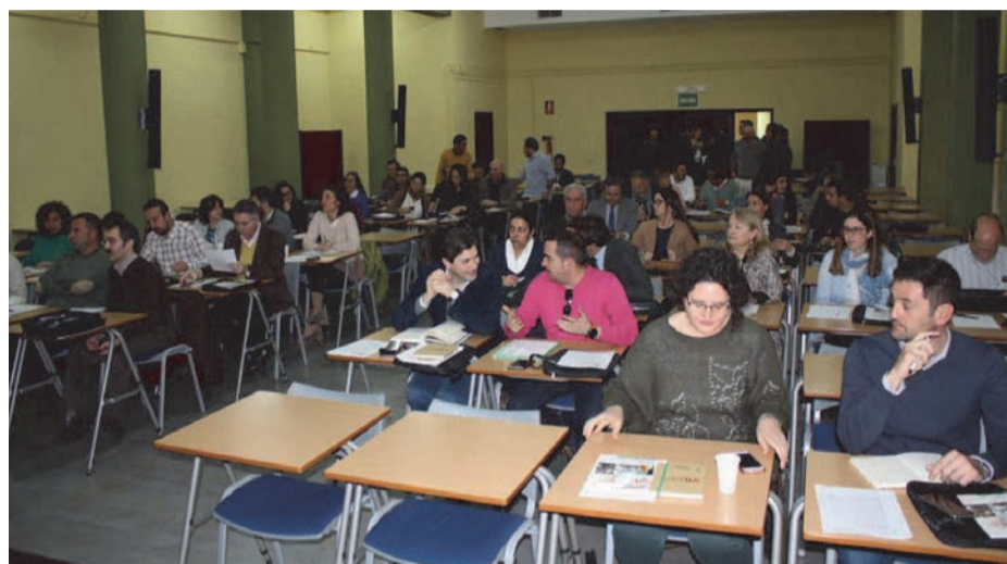
Participantes de la Jornada

En definitiva, “se trata de trabajar para garantizar la seguridad y salud de los trabajadores en la Comunidad Autónoma, así como la integración por parte de las empresas extremeñas en la prevención