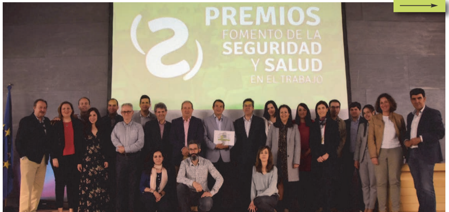
Equipo técnico de la FEMPEX en la recogida de los premios

Según el presidente de la Federación, galardones como el que acabamos de recibir suponen un "importante aliciente" para seguir adelante con la labor de difusión de la cultura preventiva y la promoción de la seguridad y la salud en el trabajo en el ámbito de la administración local extremeña.