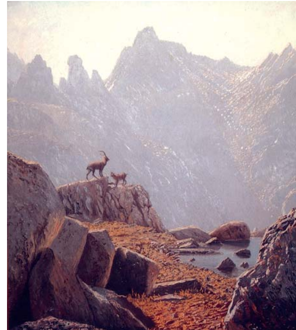
Cabras en Gredos. Oleo sobre lienzo. 1959.

Dentro del ámbito del retrato, en el que no es difícil encontrar evocaciones al paisaje con fondos de espacios abiertos a la naturaleza, se incluyen dos ejemplos de dibujo, magníficos estudios del desnudo femenino realizados al carboncillo y sanguina.