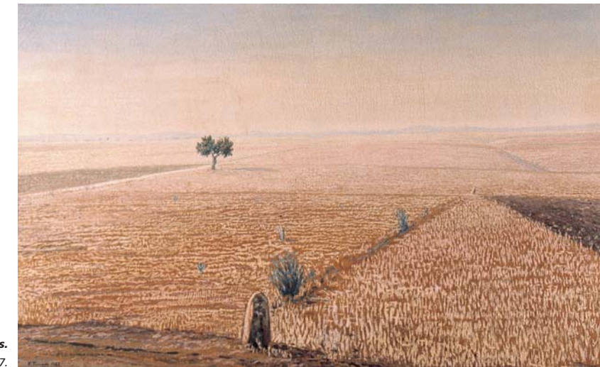
Rastrojos. Óleo sobre lienzo. 1957.

En el espacio dedicado al bodegón, faceta en la que fue premiado en varias ocasiones, encontraremos obras de temprana ejecución, aunque de conseguidas composiciones y entre las que destaca la obra Limpiando cacharros , galardonada en 1942 en la II Exposición Nacional de Arte de la obra sindical de Educación y Descanso, celebrada en el Círculo de Bellas Artes de Madrid.