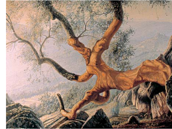
Alcornoque. Óleo sobre lienzo. S.f.