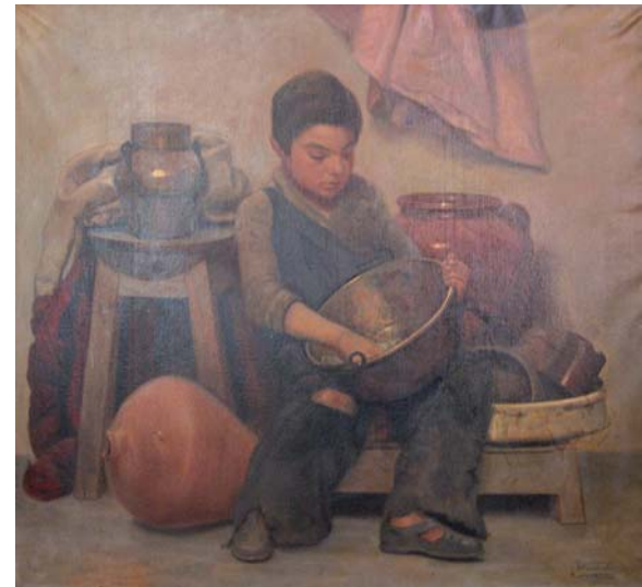
Limpiando cacharros. Oleo sobre lienzo. 1941.