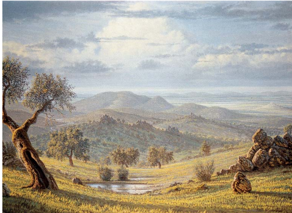
Después de la tormenta. Oleo sobre lienzo. 1972.

Con motivo del trigésimo aniversario de su muerte, el Museo de Bellas Artes de Badajoz ha querido rendir homenaje a un importante exponente artístico de la región. La muestra dedicada a la obra del extremeño Félix Fernández Torrado, que aglutina alrededor del medio centenar obras, se presenta en la planta baja del edificio 2 del Museo, siguiendo un criterio cronológico dentro de cada uno de los ámbitos diferenciados. Aunque el paisaje adquiere el mayor protagonismo, no se han dejado de lado facetas como las del retrato o la pintura de bodegones, como ponen de manifiesto obras de realización muy temprana dentro de su carrera artística que apuntaban grandes dotes para dichas temáticas y auguraban éxitos si el paisaje no se hubiese convertido en su expresión fundamental al ser el más solicitado por su clientela. Casi la totalidad de las obras expuestas pertenecen a distintas colecciones particulares, lo que responde a la clara tendencia de adaptación de la temática paisajista a la decoración de interiores de ámbito privado.