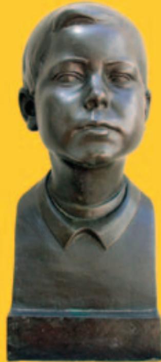
Florillo. Bronce. Fundación Codina. 43 x 18 x 16 cm. C. 1923.

En la última etapa de su vida recogió todos los éxitos sembrados con anterioridad: en 1940 obtuvo el Premio de Escultura Martínez Montañés en la Exposición Nacional de Sevilla, en 1943 se le concedió la Segunda Medalla en la Exposición Nacional de Bellas Artes y en 1945 fue nombrado académico de Número de la Real Academia de Santa Isabel de Hungría de Sevilla, en la que había sido profesor. Mauricio murió el 12 de febrero de 1948 en su localidad natal