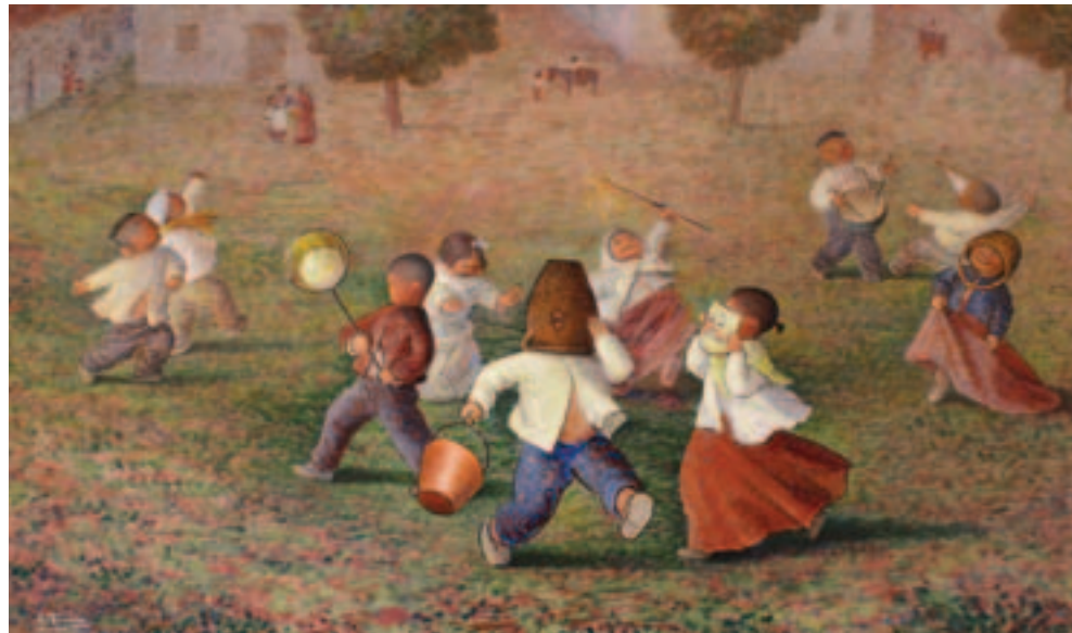
Jugando al carnaval. Óleo sobre tabla. 120,5 x 202 cm. S/f.

En esta ocasión estamos ante una doble exposición en la que la obra escultórica de Mauricio ocupa lugar en algunas salas y en el jardín las piezas hechas en materiales que permiten ser mostradas en el exterior. La obra pictórica de Alejandro ocupa obviamente las paredes de las salas interiores. Ambos hermanos y sus respectivas producciones plásticas son exhaustiva y científicamente tratados en el catálogo de la exposición, publicado para esta ocasión tras una larga investigación del profesor de la UEX el Dr. Vicente Méndez Hernán.