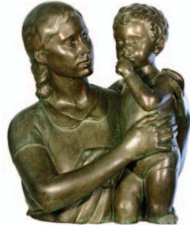
Maternidad. Bronce. 62 x 47 x 44 cm. C. 1947.

La obra escultórica de Mauricio se organiza en los siguientes temas: 1.- Bocetos de figuras infantiles, 2.-Retratos femeninos, 3.-Retratos masculinos y 4.-Escultura de animales.