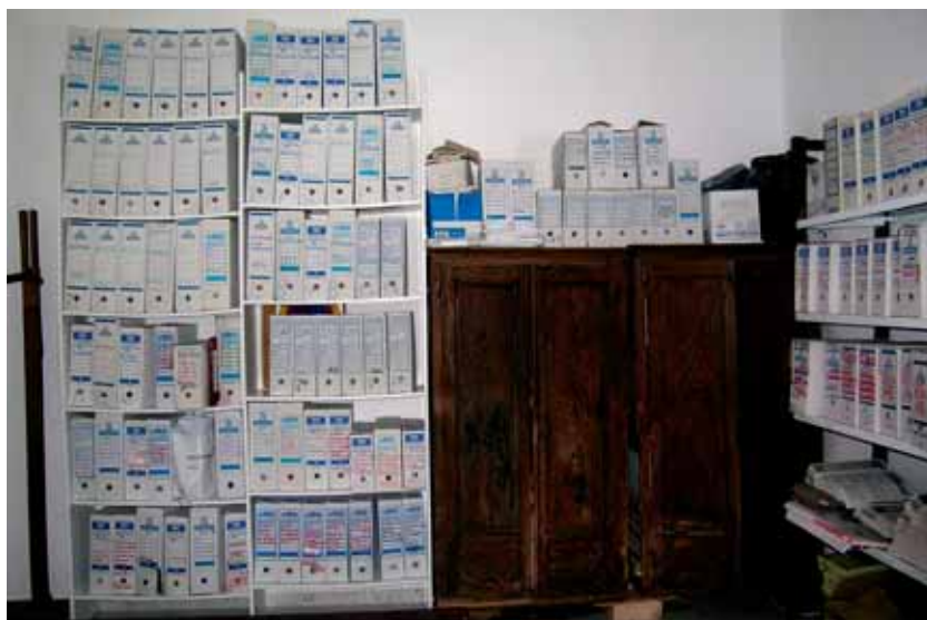
Archivo Municipal de Reina antes de elaborar el Inventario.