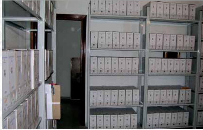
Archivo Municipal de Reina después de la elaboración del Inventario.