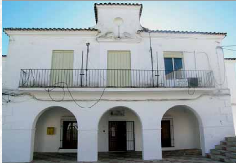
Fachada del Ayuntamiento.