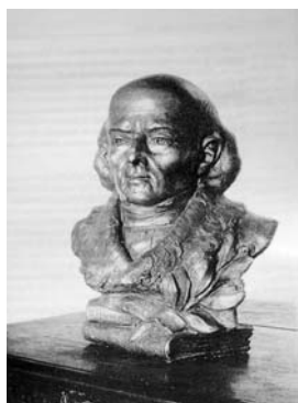
Dr. Samuel Hahnemann

Este hecho, independientemente de la importancia que se le pueda dar a la Homeopatía como disciplina médica dentro de las ciencias de la salud, no cabe duda que supone un hito histórico, ya que ello impulsó el desarrollo de una inusitada prensa médica , dinamizando un debate científico y médico inédito hasta esa época en nuestra región.