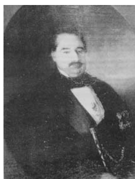
Dr. Pedro Rino y Hurtado

La semilla pronto empieza a dar sus frutos, pues un colega contemporáneo y discípulo de aquel, el Dr. Pedro Rino y Hurtado , nacido en Villar del Rey, en 1808, y médico del Hospital San Sebastián, recogerá sus enseñanzas y proseguirá con el estudio de dicha terapéutica.