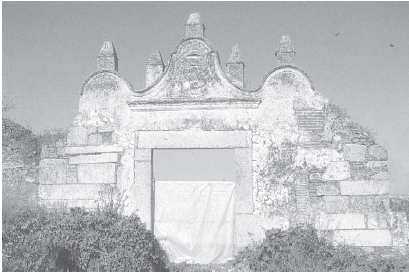
Fig. 2: Puerta de llamada de las Atalayas en el lugar donde debió erigirse el Palacio Grande del Coso