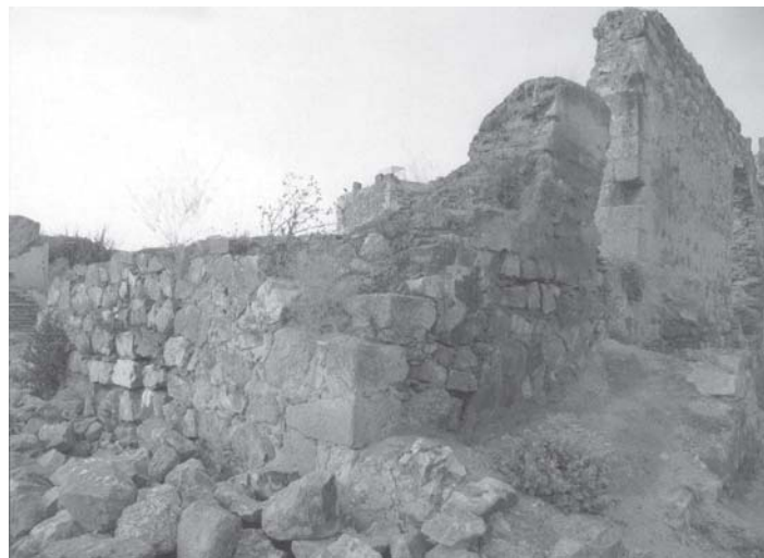
Figs. 6 y 7: Ruinas de la antigua Iglesia de Santa Maria del Castillo