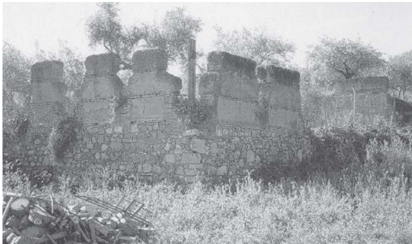
Fig. 3: Posibles muros del desaparecido Palacio Grande del Coso