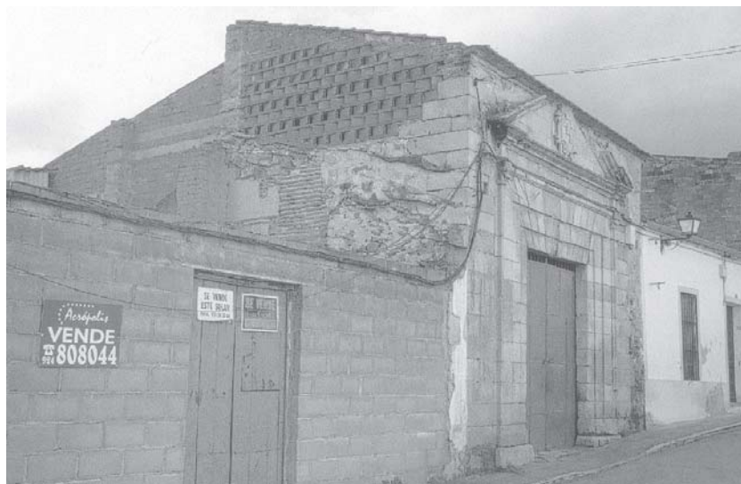
Fig. 4: Restos del Palacio Viejo de los Condes de Medellín