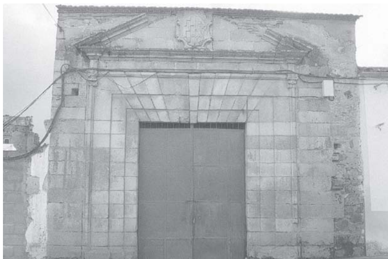
Fig. 5: Portada del Palacio Viejo