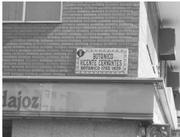
Figura 2. Fotografía de la placa de la calle Botánico Vicente Cervantes de Badajoz.

Si bien es cierto que Vicente Cervantes Mendo no es segedano, no es menos cierto que tiene vinculación con Extremadura. Por ello, se puede dar por justificado la dedicación de una calle en Badajoz en 1986. En este año pasó desapercibido que 200 años antes intervino en los Ejercicios Públicos de Botánica celebrados en el Real Jardín Botánico de Madrid, pronunciando un discurso el 6 de diciembre de 1786 en el que repasó el momento científico español.