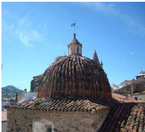
Exterior de la cúpula del Oratorio de la Enfermería de San Pedro de Alcántara