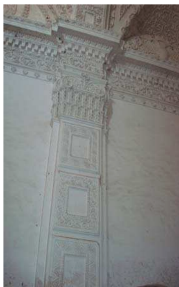
Detalle de una pilastra del Oratorio de la Enfermería de San Pedro de Alcántara