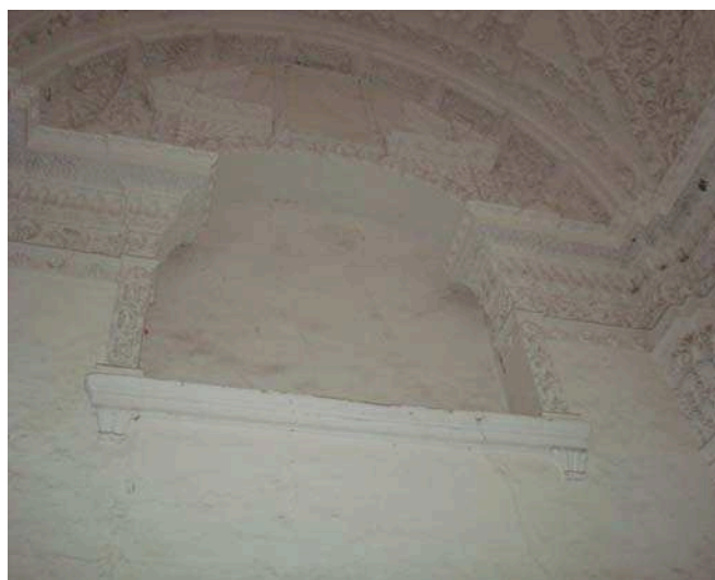
Oratorio de la Enfermería