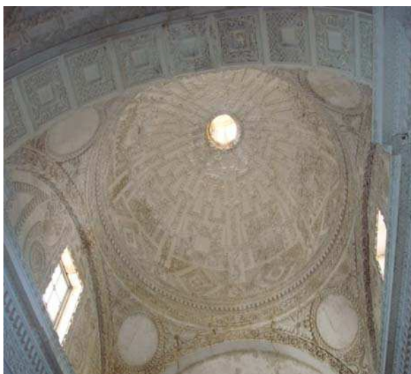
Interior de la cúpula del Oratorio de la Enfermería de San Pedro de Alcántara