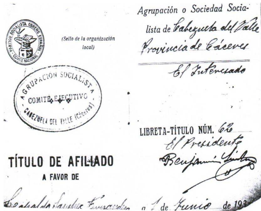
Carnet de afiliado a la Agrupación del PSOE de Cabezuela del Valle en la 2ª República (AHPC)