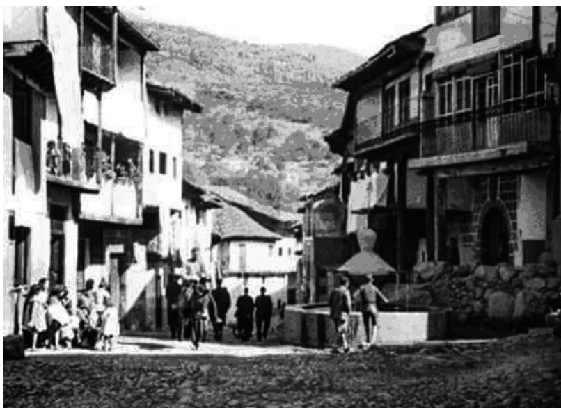
Cabezuela a mediados del siglo XX

en Valsequillo 30 , entre Navaconcejo y Cabezuela. Además, se pasaban de La Vera al Valle y de este al Ambroz o más lejos.