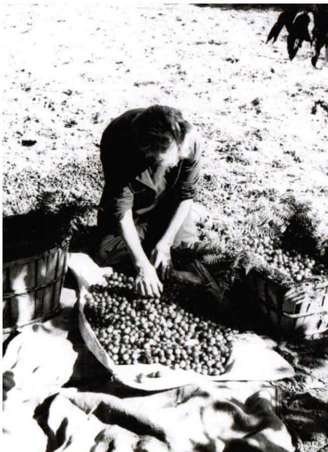
Mujer escogiendo cerezas, al estilo tradicional, en el Valle del Jerte en la década de los setenta. (Foto de F. Flores).

locales acabaron unificándose, no sin dificultades, en la Agrupación de Cooperativas del Valle del Jerte , pionera en el asociacionismo agrario extremeño, tras constituirse en 1972 el Concierto Intercooperativo para una mejor defensa del producto en los mercados nacionales e internacionales. A mediados de los ochenta se convirtió en Asociación de Productores Agrarios y en los noventa, en Organización de Productores de Frutas y Hortalizas.