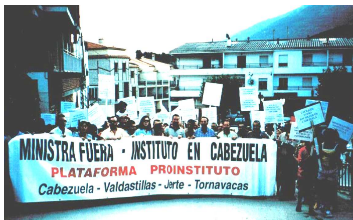
Manifestación pro-instituto en Cabezuela del Valle a finales del siglo XX.