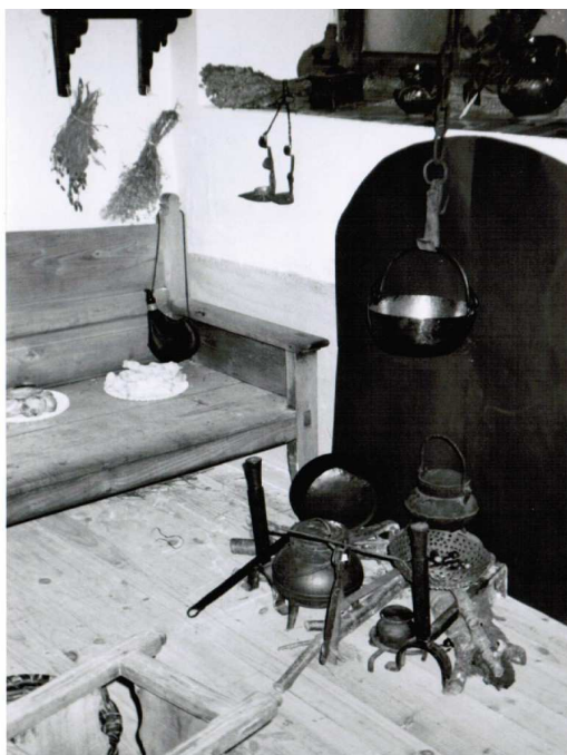
Casa tradicional del Valle del Jerte.

Lo que resulta ya inevitable, por imposición de los cambios habidos en estos nueve decenios, es la división del espacio interior de las viviendas valxeritenses, pensadas antaño para cohabitar personas y animales. La casa tradicional mantenía hasta los años sesenta una serie de dependencias agropecuarias -cuadras para el ganado doméstico, almacén de aperos, de productos del campo, cocina con secadero, etc.- que ya quedaron obsoletas al ser sustituida la caballería por el automóvil y la cocina de leña por la eléctrica o de gas. Los nuevos tiempos han alterado el modo de vida en los hogares rurales, cada vez más parecidos a los de cualquier ciudad.