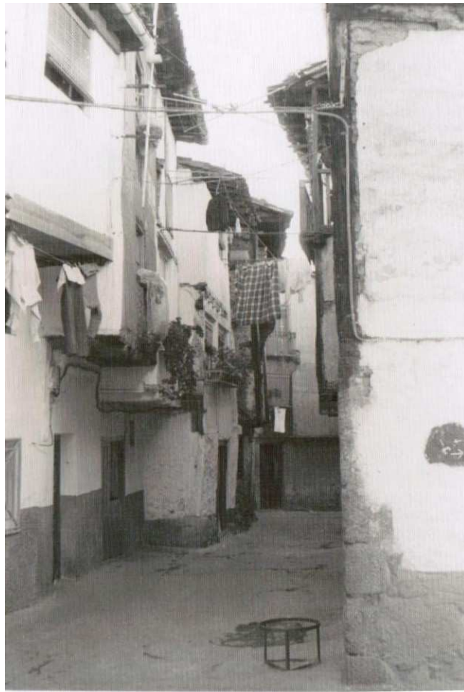
Calleja de la Cárcel en Cabezuela del Valle, villa declarada Conjunto Histórico en 1998.

En resumen, el Valle del Jerte está a la cabeza en el universo de la cereza, siendo el primer productor y comercializador de este producto en Europa.