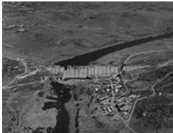
5: Panorámica general de la presa y antiguo cauce del río (C.H.G.).