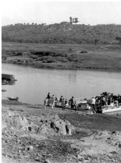
La Barca, 1950. Al fondo se ve el Monte la Barca

Conflictividad comprensible desde el momento en que debía ser una zona de tránsito muy importante hacia la Serena, por lo que los beneficios no serían despreciables. No olvidemos que la referida barca ha sido el único medio de cruzar el Guadiana hacia la Serena hasta la construcción del embalse. La gestión de la barca en el siglo XX ha correspondido a la Diputación Provincial, también de las existentes entre Casas de Don Pedro-Talarrubias y Valdecaballeros-Pelоче-Herrera del Duque.