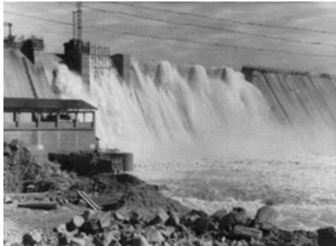
4: Colmatación y desborde de la presa en 1958-59 por crecida del Guadiana (C.H.G.).