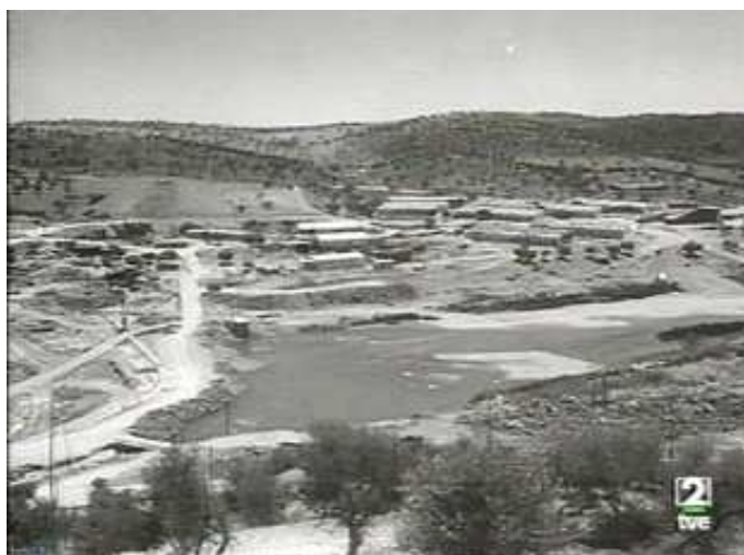
1: Atagúa sobre el cauce (C.H.G).