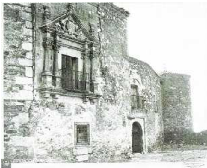
Fachada principal del Palacio de los Orellana

El Palacio de los Orellana, tal como era a comienzos del siglo XX, su estructura y patio interior, nos ha llegado gracias al testimonio gráfico del fotógrafo pacense Fernando Garrorena en su viaje con Adelardo Covarsí por la Siberia Extremeña 62 .