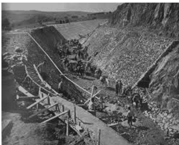
6: Construcción del Canal de Orellana (C.H.G.).