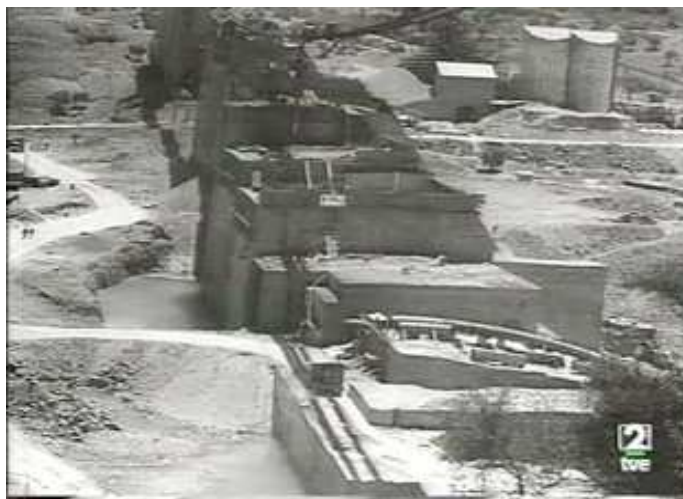
2: Inicio de la estructura (C.H.G.).