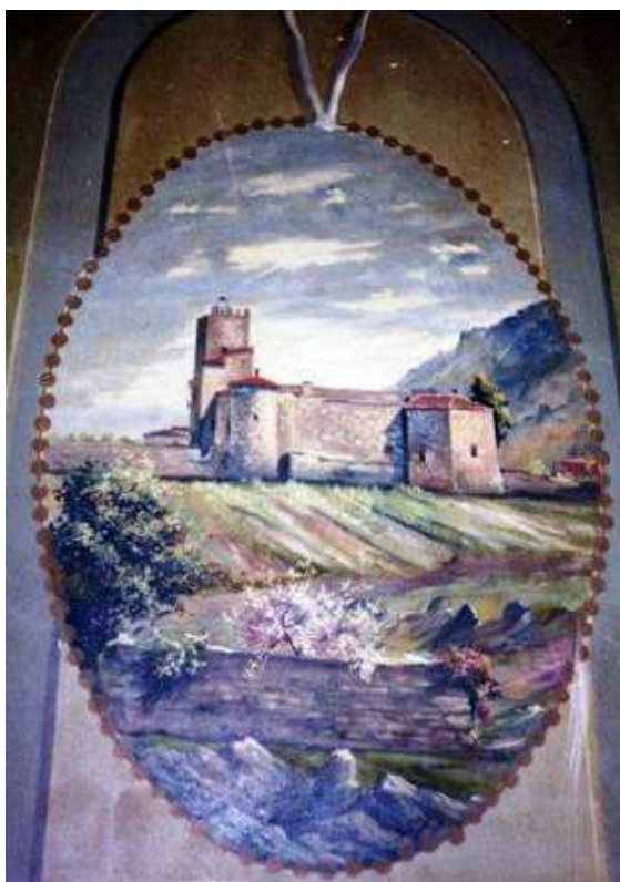
Pintura del Palacio en zaguán de casa en c/ Real, 1