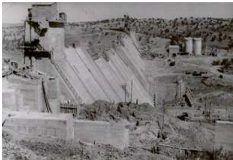
3: Fase intermedia (C.H.G.).