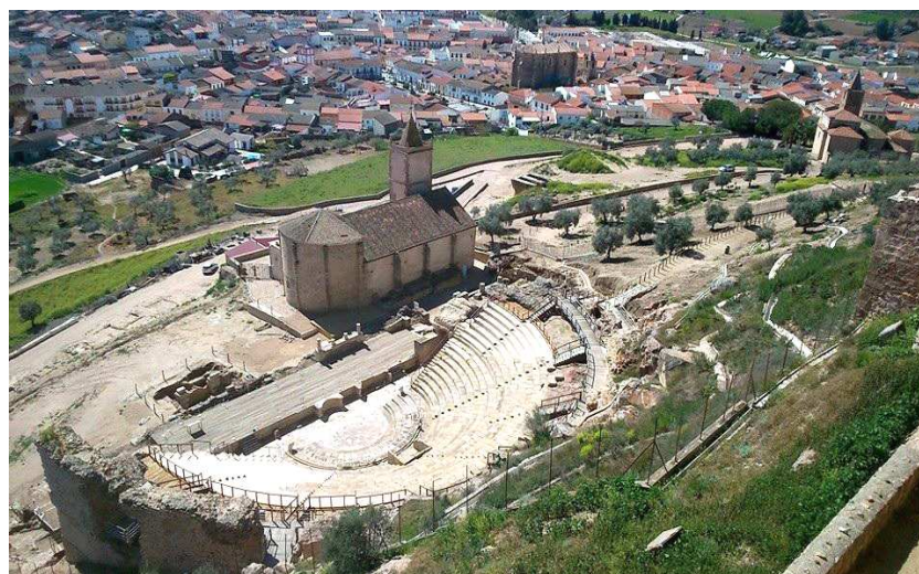
Fig. 5. Teatro romano de Metellinum. Abierto al público desde julio de 2013.