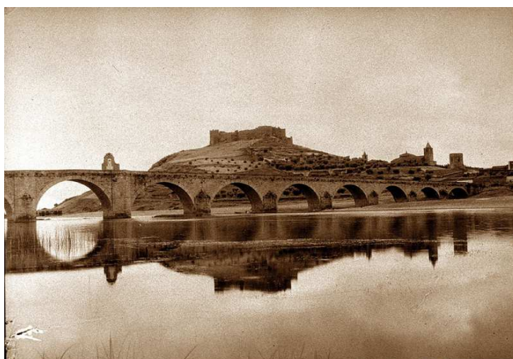
Fig. 1. Vista del puente de 1630, el castillo, Portaceli y las antiguas parroquias de San Martín y Santiago. (c.a. 1928).

“Lo inesperado es encontrarse con un pueblo que parece muerto, o por lo menos condenado a muerte, que no llega a dos mil habitantes y que llena de chicos cuatro escuelas. Aquí no hay descuido [...]. Cada maestro tiene más de noventa niños de matrícula. Asisten con bastante regularidad, [...] con tal interés, que pronto va a construir el Ayuntamiento un grupo de otras cuatro escuelas.” 5