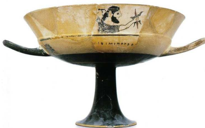
Fig. 3. Kylix de Eucheiros . El hallazgo de dos fragmentos de esta pieza, en la excavación de un pozo de riego -en la segunda mitad de los sesenta-, actuaría como detonante para iniciar la intervención sistemática y el descubrimiento de la necrópolis tartesia de Conisturgis (Medellín).