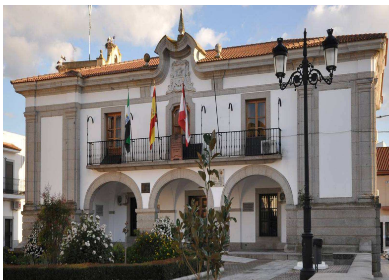
Fig. 2. El nuevo edificio del Ayuntamiento fue una de las realizaciones de la Dirección Gral. de Regiones Devastadas. Se inauguró el día 1 de Mayo de 1957 y su coste fue de 1.056.000 ptas., más 250.000, de mobiliario.

tes públicas para servicio de agua potable. En mayo de 1957 se inaugura la remodelación de la Plaza de Hernán Cortés el edificio del nuevo ayuntamiento 36 . Las otras construcciones que llevó a cabo Regiones Devastadas , en Medellín, y que fueron inauguradas en esta misma década fueron: los edificios del Colegio, las Casas de Maestros, la Casa Cuartel de la Guardia Civil, cerramientos exteriores en Santa Cecilia y algunas reparaciones en este templo y en el de San Martín.