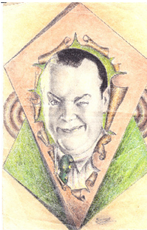
Caricatura de Ortas

El domingo 4 de octubre de 1908, la compañía cómico-lírica de Casimiro Ortas Navarro, al que acompañaba su hijo y la que sería su nuera, la tiple Carmen Sobejano, abrieron la temporada en el teatro Cervantes de Sevilla, donde presentarían cuatro obras: La reina mora , Carceleras , El iluso Cañizares y La gatita blanca .