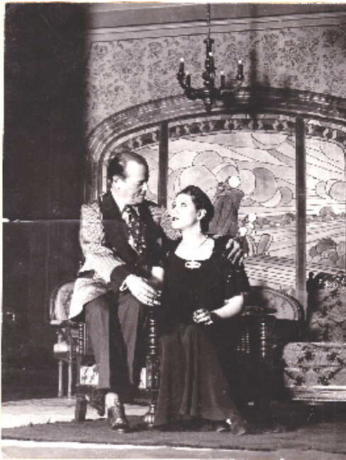
1930: Ortas y Aurora