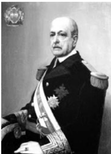
Fig. 10.- D. José María de Beránger y Ruiz de Apodaca, vicealmirante y ministro de Marina entre 1870 y 1871.