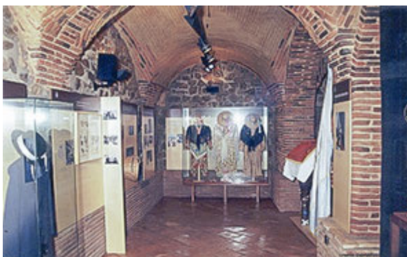
Fig. 17.- Museo de la Octava del Corpus en Peñalsordo.