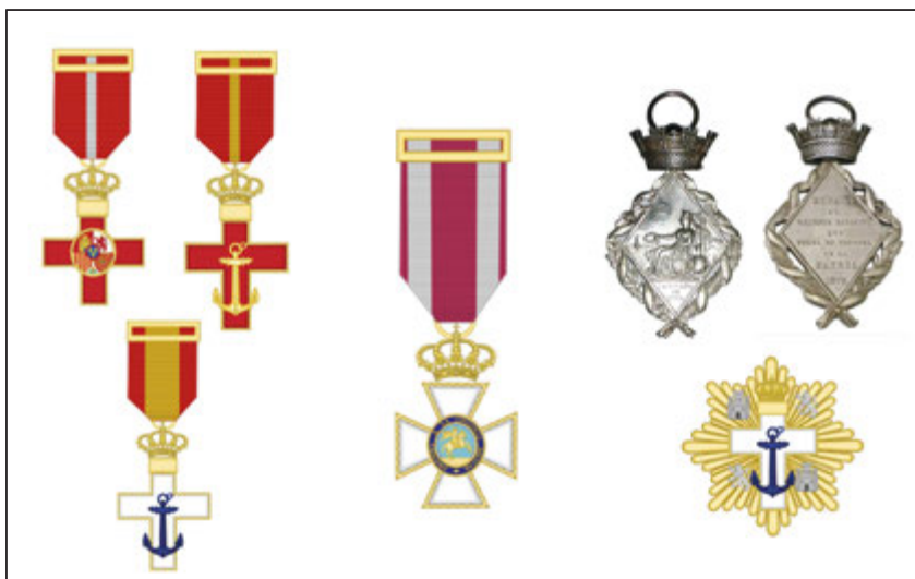
Fig. 7.- Condecoraciones concedidas a Antonio Adriano Tejero y Pizarro durante su carrera militar. Arriba a la derecha, la Medalla Conmemorativa de la Campaña Isla de Cuba.