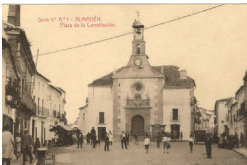
Fig. 16.- La Plaza de Almadén a principios del siglo XX