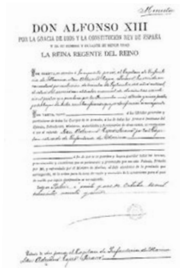
Fig. 2.- Concesión de retiro que figura en el expediente militar del capitán Antonio Adriano Tejero y Pizarro.