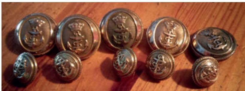
Fig. 21.- Botonadura del uniforme de Capitán de Infantería de Marina de Antonio Adriano Tejero y Pizarro.

Con esta breve semblanza de uno de los personajes de nuestra tierra hemos querido rendir homenaje a todos aquellos que, de forma más o menos anónima, han contribuido a nuestro acervo histórico local. Esta investigación dará pie a la búsqueda y aparición de nuevos datos.