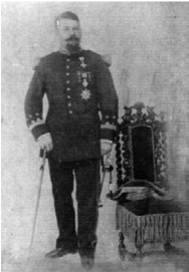
Fig. 4.- Antonio Adriano Tejero y Pizarro con el uniforme de capitán de Infantería de Marina condecorado.