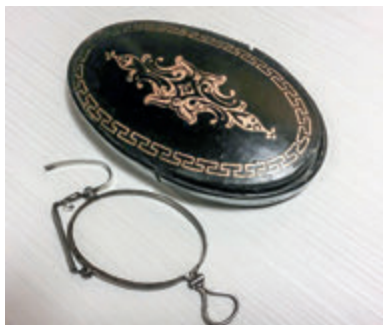
Fig. 19.- Lentes y estuche.