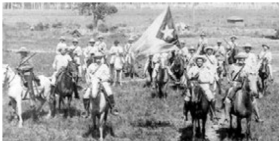
Fig. 12.- Batallón de caballería de las tropas mambises durante el conflicto de la Guerra de los Diez Años .