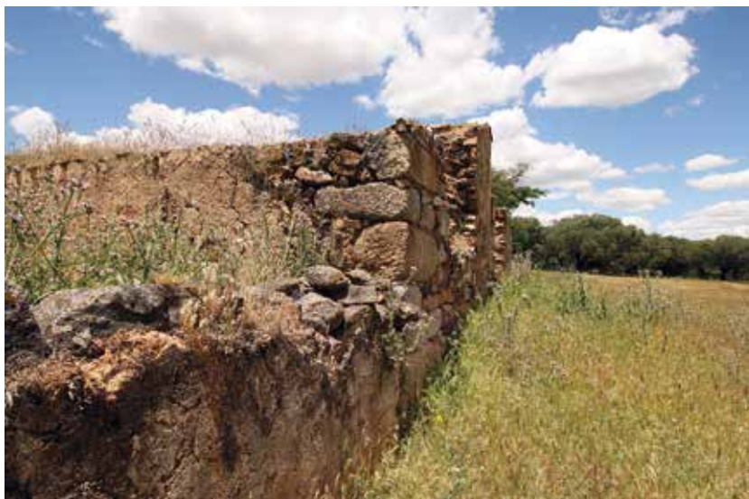
Fig. 6. Posible cupa inserta en la fábrica de una construcción rural sita al Este del cerro de San Jorge

parcialmente, la ciudad de Nertobriga (Fregenal de la Sierra, Badajoz), arroja al corpus epigráfico actual tan sólo un total de nueve inscripciones funerarias 43 . Las implicaciones emanadas de su presencia y número ya nos ponen en alerta, pues, sobre una realidad ineludible: la de la cercanía de una necrópolis asociada, a su vez, a un núcleo poblado con la suficiente entidad como para justificarla.