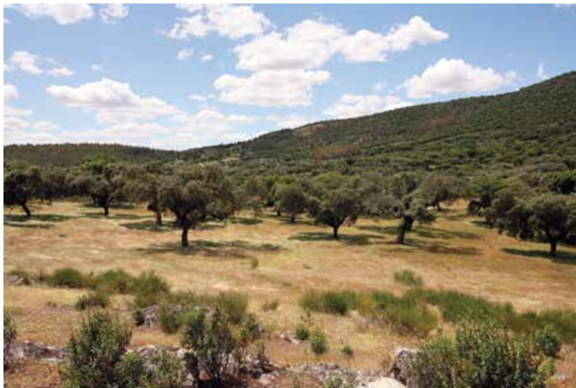
Fig. 7. Cumbre norte del cerro de San Jorge, con vistas a la basílica de Santa Lucía del Trampal

En la planimetría vigente, el paraje no recibe nombre alguno, si bien es conocido por la historiografía bajo la designación de San Jorge. Dicho nombre se lo debería al parecer a una ermita existente en sus inmediaciones y citada aún en el siglo XVII por Moreno de Vargas, junto a la de Santiago 51 . De tal topónimo persiste un eco en la cartografía del I.G.N., manifestado en el arroyo de San Jorge, que nace precisamente de nuestro paraje. Otra designación que parece haber recibido la zona es la de Los Godinos 52 , de posibles e interesantes connotaciones arqueológicas, al poder remitir a nivel popular a los godos, a quienes los habitantes del entorno atribuirían legendariamente la presencia de los vestigios del asentamiento humano perceptibles en el Trampal.