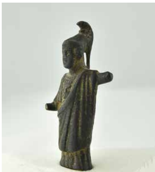
Fig. 9. Figura de Minerva de bronce, hallada en el palacio de los Comendadores de Alcuéscar y conservada en el Museo de Cáceres con el n.º inv. 576

independientemente de que mantengan cierta continuidad inercial, acaben por ser reocupados ya durante la Antigüedad tardía o la Alta Edad Media en aras de sus mejores cualidades defensivas, lo que vendría a explicar la coincidencia entre un poblamiento prerromano y otro ulterior, a veces incluso después de un amplio lapso de abandono.