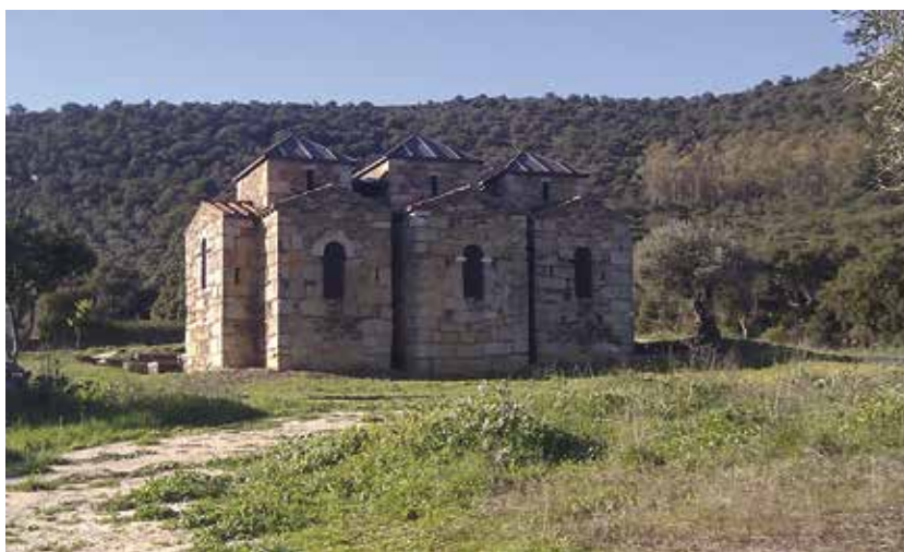
Fig. 2. Estado actual de la basílica de Santa Lucía del Trampal

localización del enclave debía alejarse del ámbito andaluz para ser aproximado al punto neurálgico de las referencias a la misma, coincidente con el principal santuario de Ataecina . Este es el punto de partida, pues, para la consideración de la existencia de una entidad inserta presuntamente en el panorama extremeño y posiblemente conocida con el nombre de Turibriga .