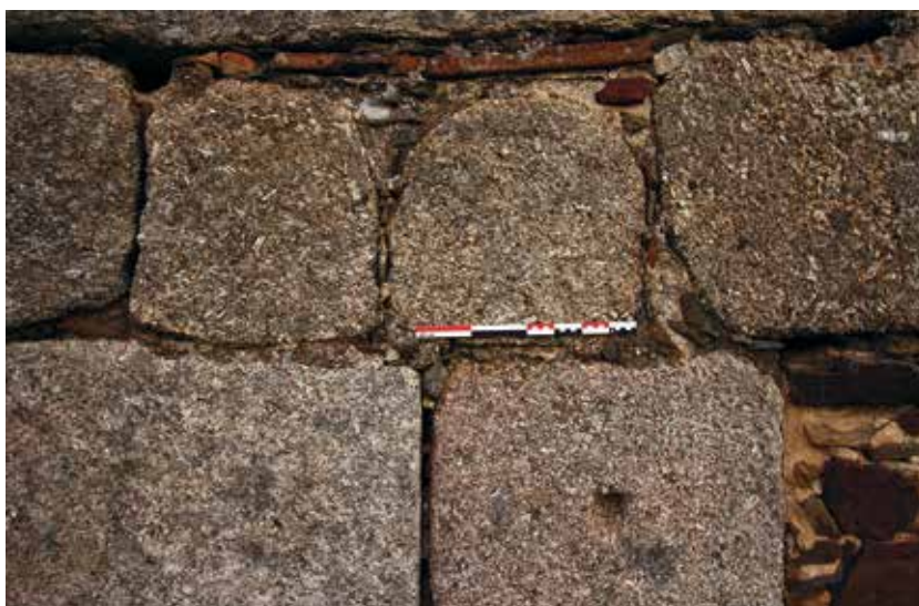
Fig. 5. Monumento funerario tipo cupa , inserto en la fábrica de la basílica de Santa Lucía del Trampal. Obsérvese también por debajo un sillar con orificio para forceps.

definibles gracias a su peculiar formato, pese a su actual carácter anepígrafo: nos referimos al número relativamente elevado de cupae que puede contarse agrupando tanto los dos ejemplares insertos en la fábrica de Santa Lucía (fig. 5), como el custodiado en el depósito del actual centro de interpretación anexo o, finalmente, algunos posibles más, distribuidos en torno a la vertiente meridional de la colina de San Jorge, insertos en tapias o fábricas de construcciones rurales (fig. 6).