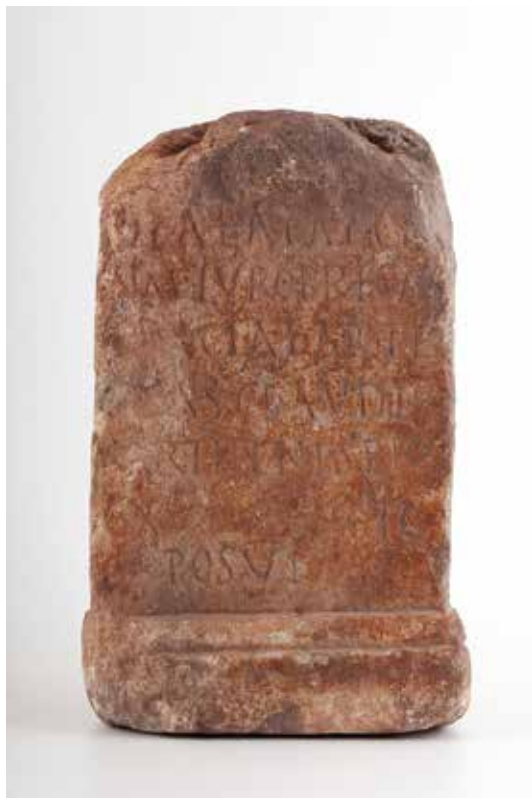
Fig. 3. Ara conservada en el Museo Arqueológico Nacional de Madrid con el n.º inv. 34450, en la que se vincula a Ataecina con el topónimo Turobriga , quizá como producto de una errata

identificado con la antigua población de Arucci . El yacimiento en cuestión, por lo demás, viene siendo objeto de campañas sistemáticas de excavación hasta la fecha, manifestando un notable desarrollo urbano en el que destaca la presencia de un foro 12 .