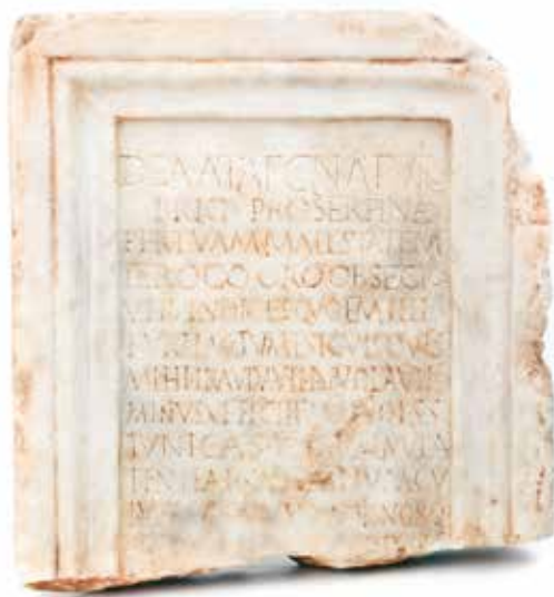
Fig. 4. Lápida dedicada a Ataecina , conservada en el MNAR con el n.º inv. 10302, en la que se registra una de las consignaciones más extensas del topónimo Turibriga

de un error de lectura 28 . Ello, unido a la invariable disposición de la voz tras la referencia a la divinidad Ataecina , ha devenido de un modo generalizado en la adición de un sufijo -ense a la expresión epigráfica del topónimo. Sin embargo, hemos de advertir que la recreación de tal terminación con vistas a la formación de un gentilicio coherente, ha sido recientemente criticada por Guerra en un extenso artículo precisamente focalizado casi de un modo exclusivo en el análisis de la voz que nos ocupa 29 .