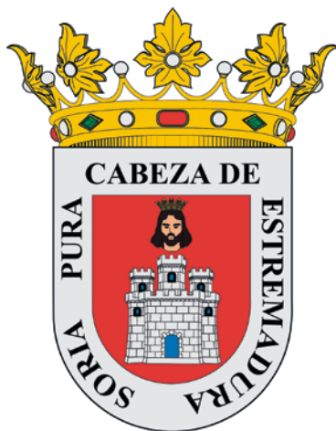
Escudo de la ciudad de Soria, cuya leyenda figuraba en una campana de la torre de la colegiata de San Pedro, hacia el año 1547, antes del derrumbe de dicha torre.

Como he mencionado anteriormente, allí, en las tierras sorianas, también topé con Extremadura, «Soria Pura Cabeza de Extremadura», figura en el escudo de esa ciudad.