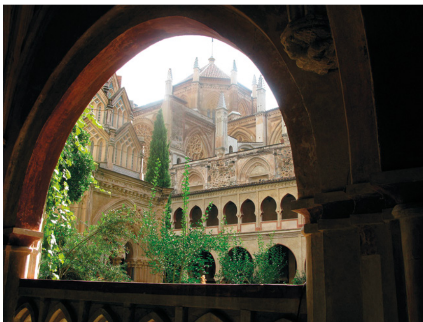
Monasterio de Guadalupe

los oficios religiosos tan sólo asistían en sus pueblos de procedencia, allá en los agostaderos serranos, durante la estancia de verano. Durante su ciclo trashumante, rindieron devoción a las imágenes titulares de las numerosísimas ermitas que se extendían por toda la geografía de Extremadura, situadas a lo largo de todas las cañadas y cordeles. Y hasta coincidieron en la veneración a la Virgen de Guadalupe. Allí en el año 1411 se celebró una Junta de La Mesta, según consta en el pie de un cuadro situado en una capilla del Monasterio: