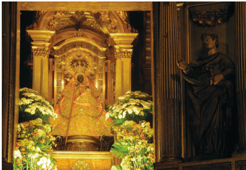
Imagen de la Virgen de Guadalupe