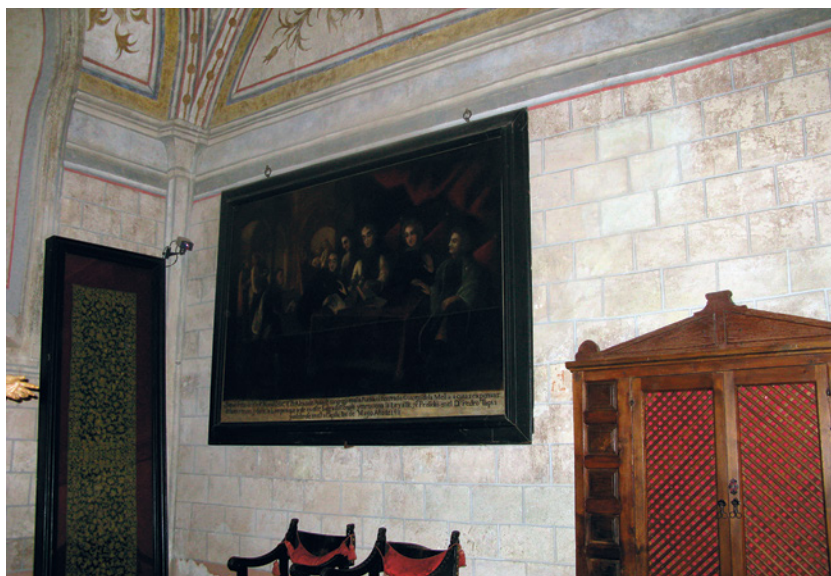
Capilla donde se encuentra el mencionado cuadro