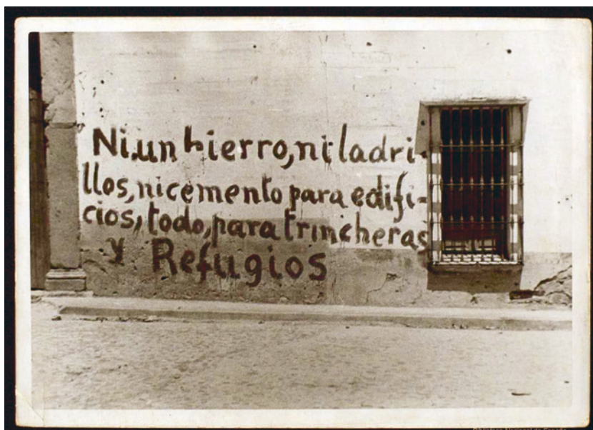
Fig. 4. «Frente de Extremadura: Don Benito. Un letrero marxista que es todo un programa» (27-07-1938).