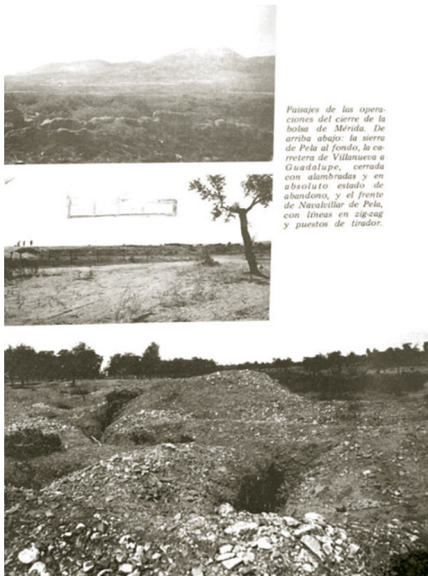
Fig. 3. Paisajes de las operaciones del cierre de la Bolsa de Mérida (entre ellas, N. de Pela). Apud MARTÍNEZ BANDE, J. M., op. cit.

En el parte oficial de guerra figura: «cogiendo 253 muertos del enemigo y abundante material entre el que figuran muchas ametralladoras y fusiles ametralladores» 14 . Como dijo Negrín en su discurso a la Nación española «la más de las veces, al vencedor lo hace el vencido» 15 . La ineficaz resistencia que ofreció la parte republicana queda manifiesta en el comunicado que dirige el