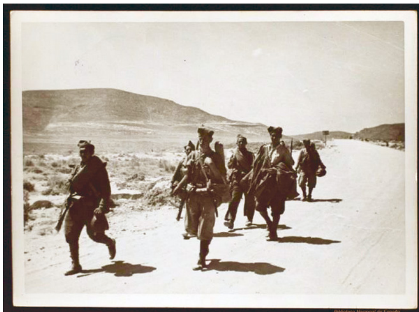
Fig 1. Avanzadillas de Franco, se dirigen a ocupar Villanueva de la Serena (27-07-1938).