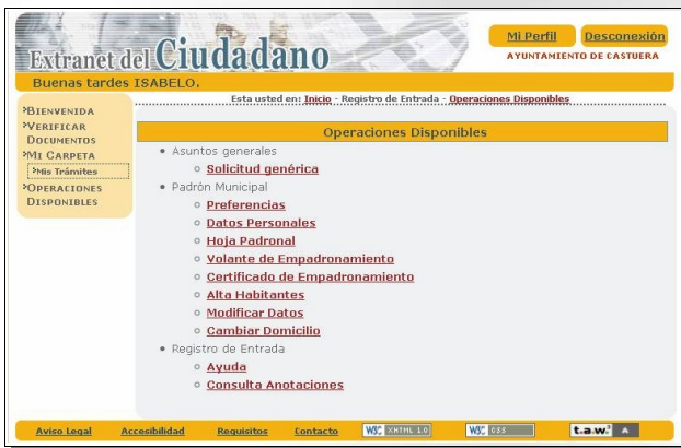
Página web: Extranet del Ciudadano