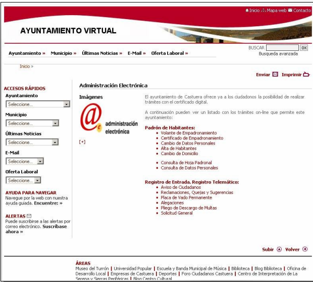
Página web: Ayuntamiento Virtual