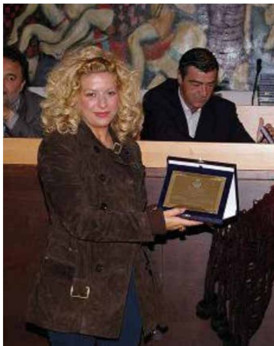
Premio Cilento Donna (2011)