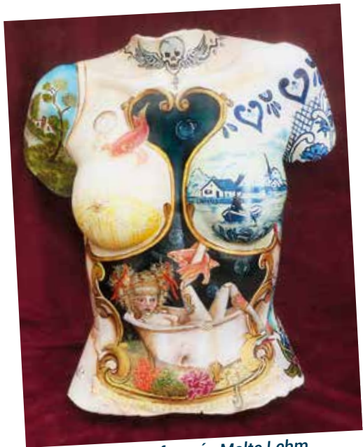
Obra del escultor francés Malte Lehm intervenida por Ana. "Nereida" (2019)

Más elementos corpóreos intervenidos por Ana H. San Pedro, han sido, por ejemplo, diferentes hormas de madera muy antiguas, conejos de porcelana y resina, ángeles y vírgenes y varios muebles que, claramente, vuelven a tomar vida y convertirse en algo completamente diferente a lo que en principio fueron.