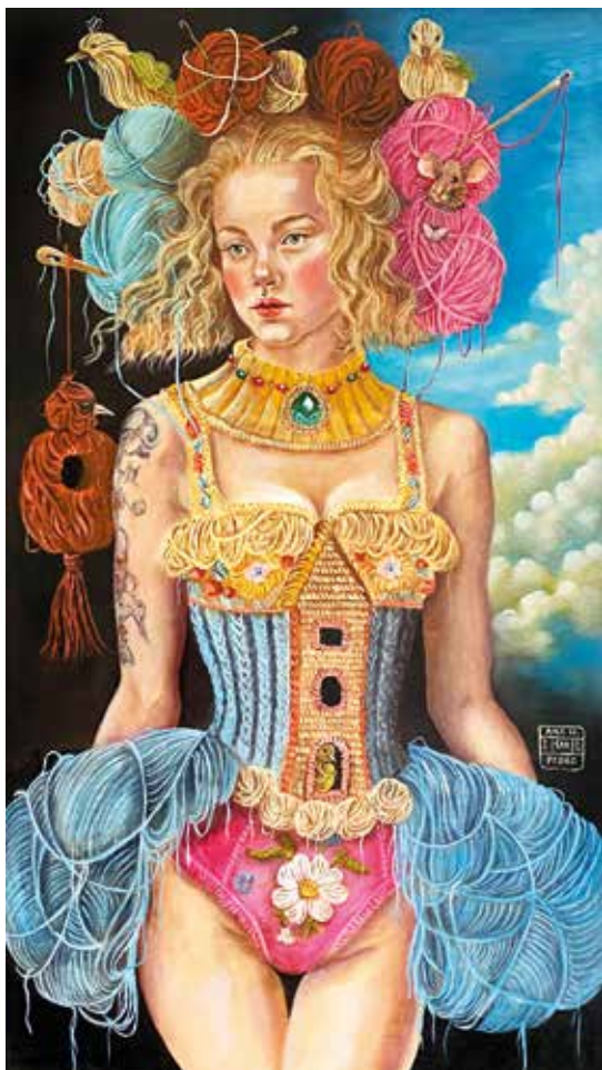
TEJEDORA DE SUEÑOS II Óleo sobre tabla. 50 x 90 cm. 2024.