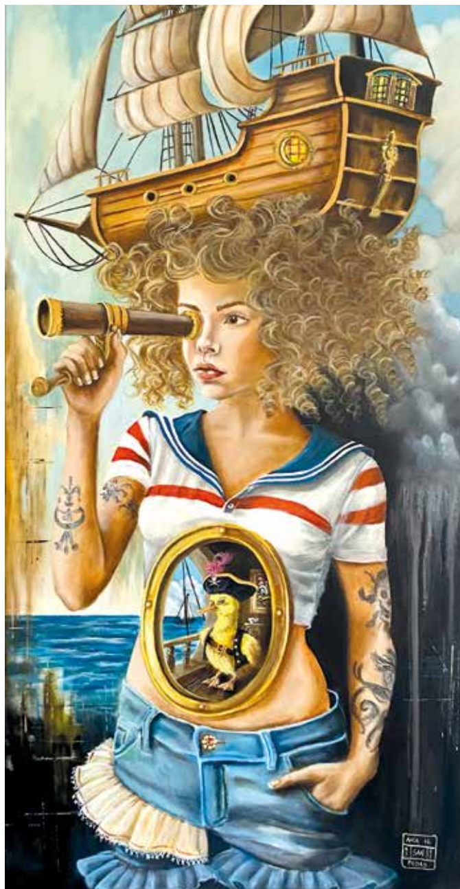
LUDO MENTIS IV Óleo sobre lienzo 50 x 100 cm. 2025.