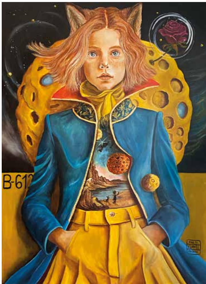
B-612 Óleo sobre tabla. 50x70 cm. 2024