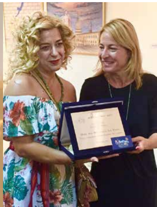
Premio Arco Baleno (2017)