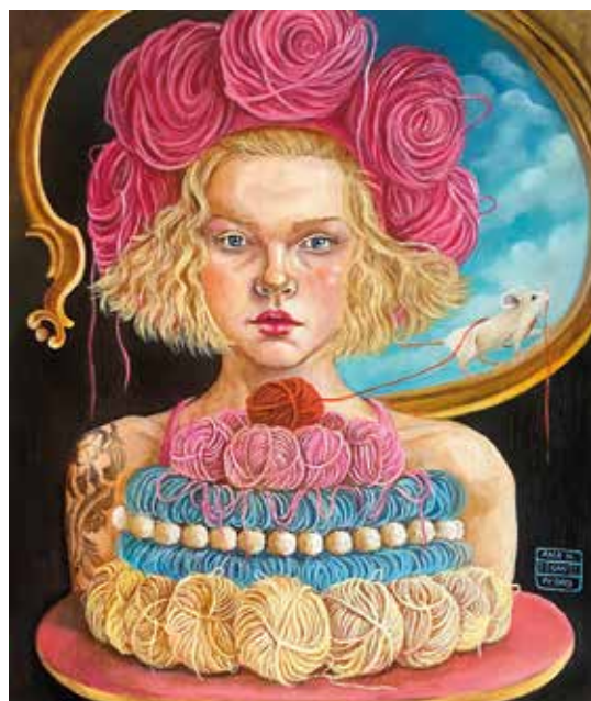
TEJEDORA DE SUEÑOS III Óleo sobre tabla. 50 x 60 cm. 2024.