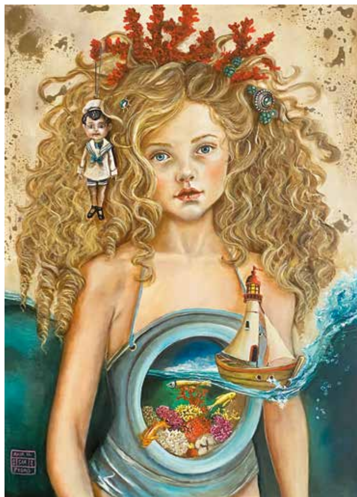
ACUAMARINA I Óleo sobre tabla. 50x70 cm. 2024