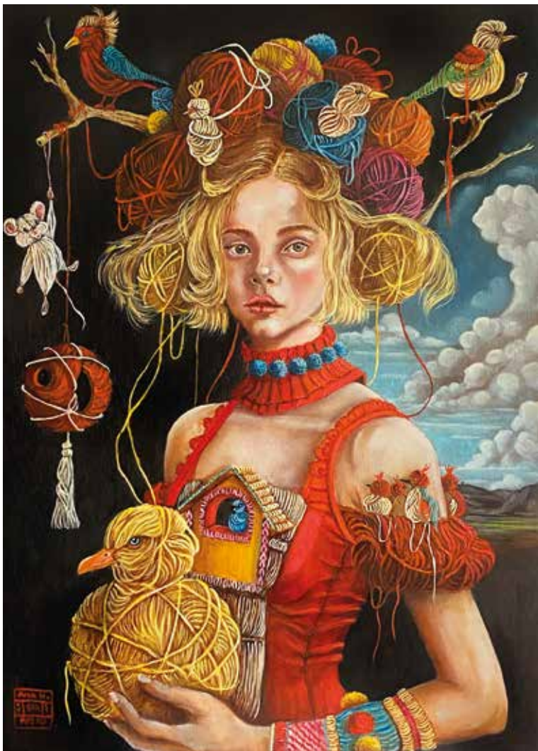
TEJEDORA DE SUEÑOS I