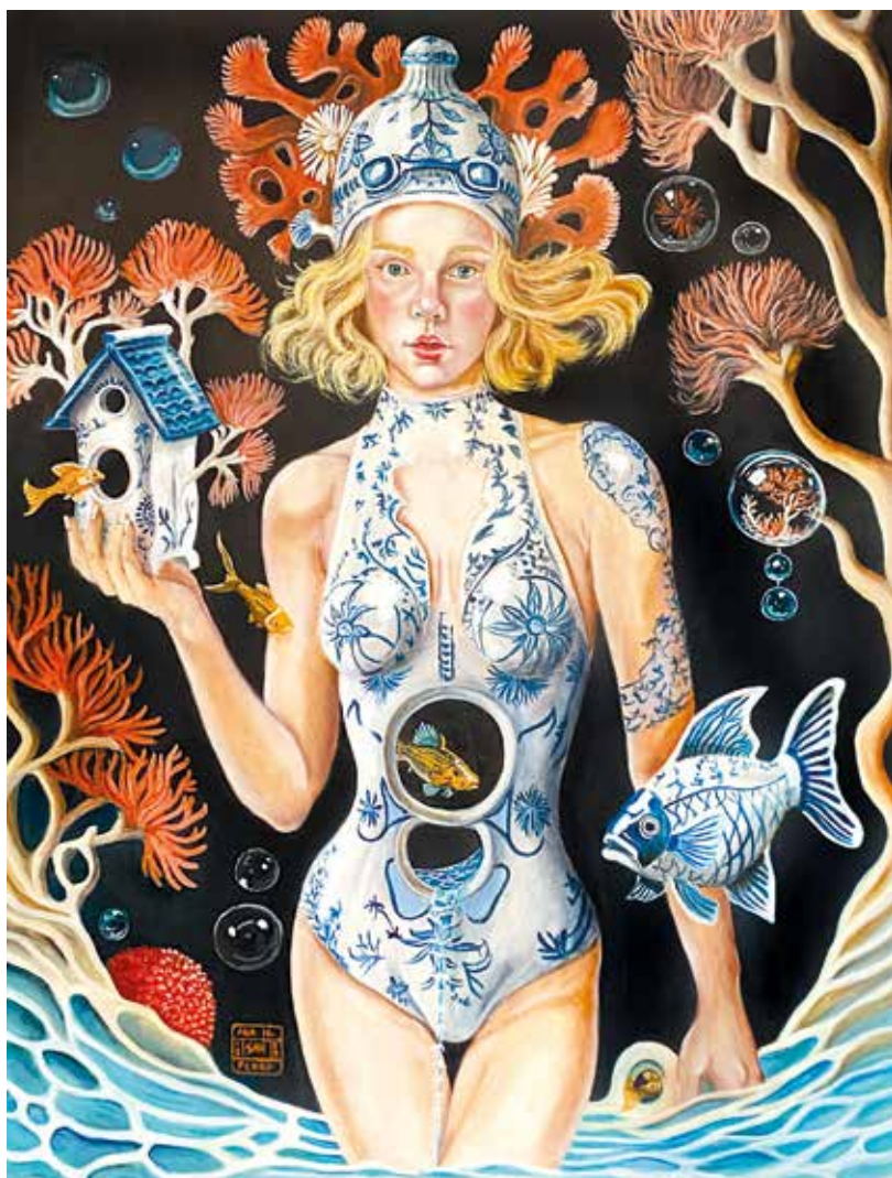
THE DREAMING POOL III Óleo sobre tabla. 70 x 90 cm. 2023.