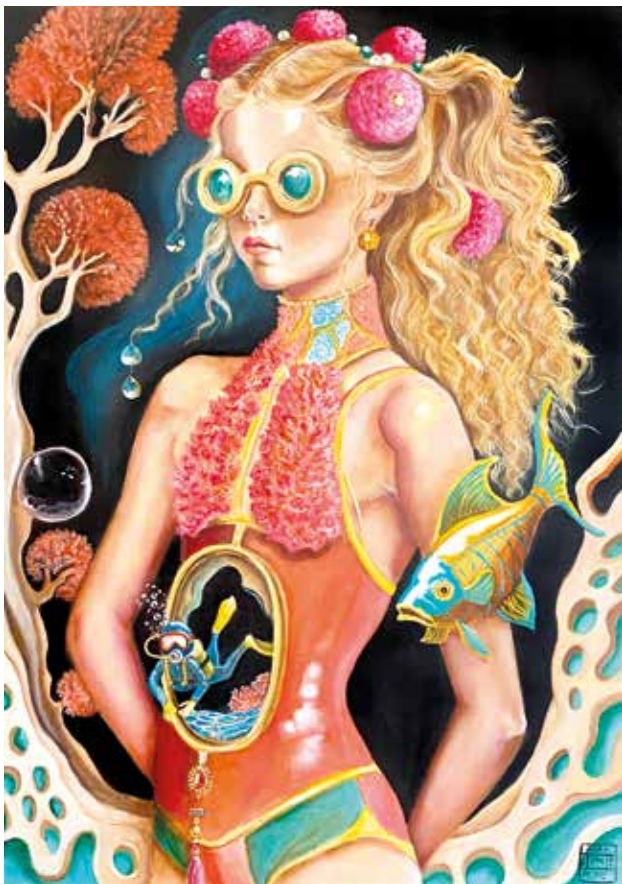
THE DREAMING POOL IV Óleo sobre tabla. 50 x 70 cm. 2024.