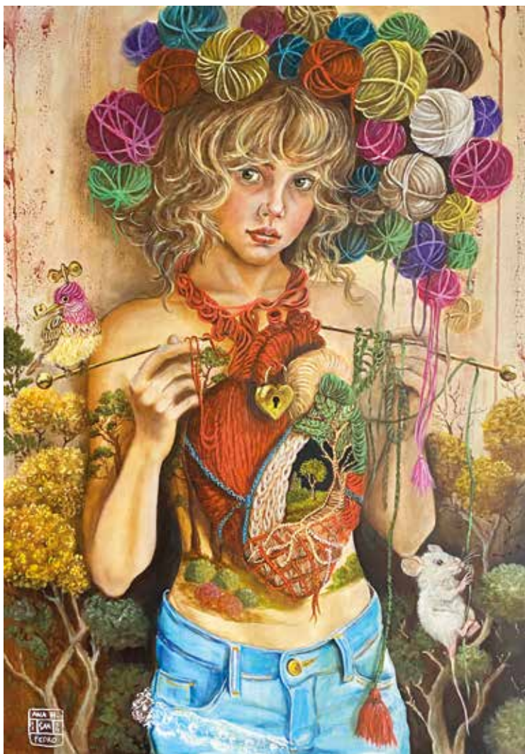
TEJEDORA DE SUEÑOS IV Óleo sobre tabla. 50 x 70 cm. 2024.