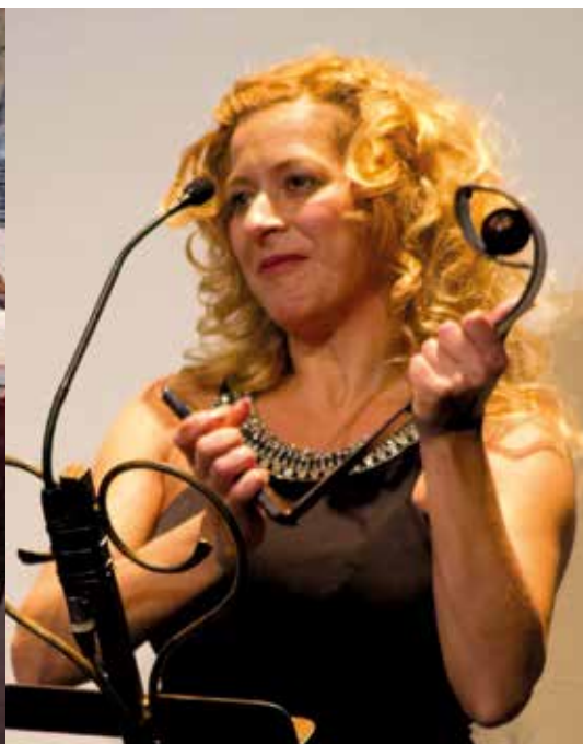
Premio Pop-Eye (2014)