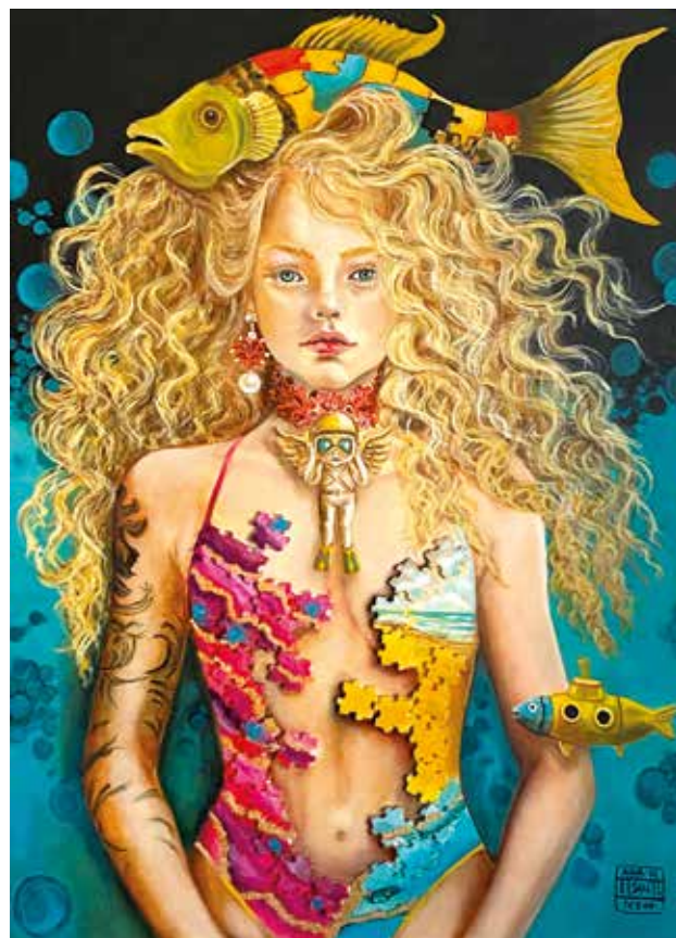
THE DREAMING POOL V Óleo sobre tabla. 50 x 70 cm. 2024.