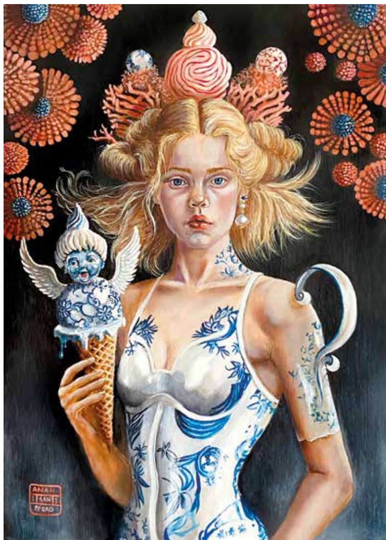
THE DREAMING POOL II