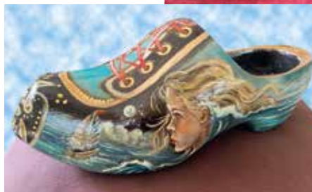
Diferentes hormas y zueco holandés antiguo, intervenidos y decorados por Ana H. San Pedro