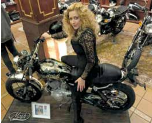
Personalización de una moto Mash a través de la intervención del depósito para la puesta de largo del nuevo concesionario oficial de la marca en Madrid.