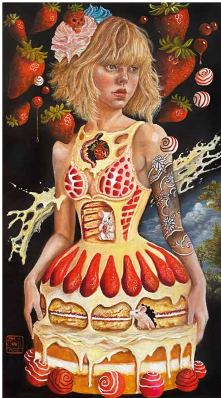
OPULENCE II Óleo sobre tabla. 50 x 90 cm. 2024.