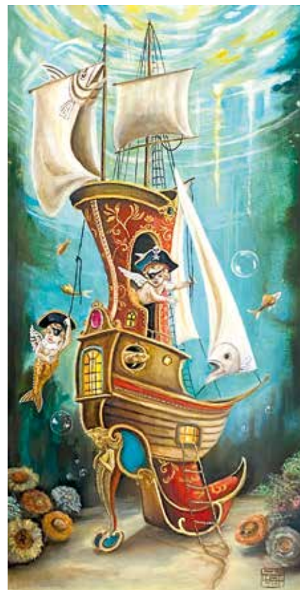
THE MARVELOUS LUNA PARK Óleo sobre tabla. 50x70 cm. 2024