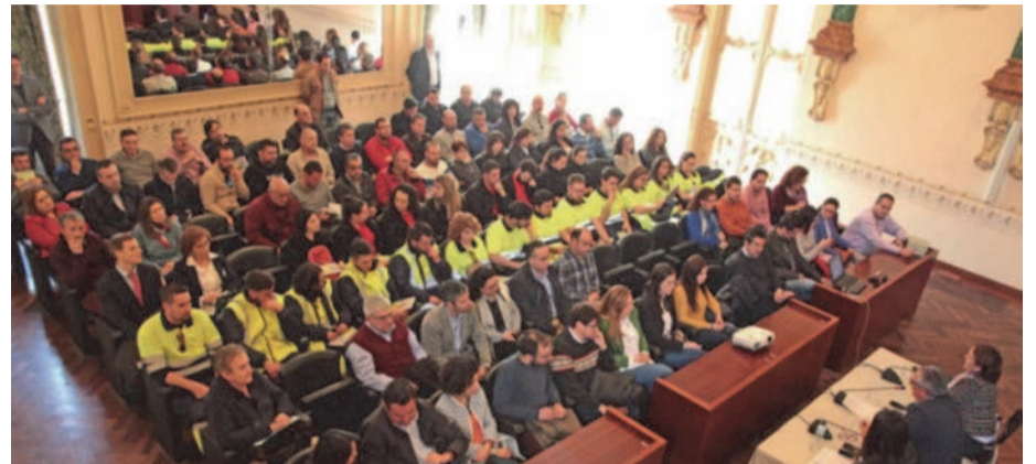
Participantes de las Jornadas

Además de esta jornada, la Diputación de Badajoz organizó durante esta Semana de la Prevención, una jornada de sensibilización sobre el acoso laboral el Salón de Plenos de la