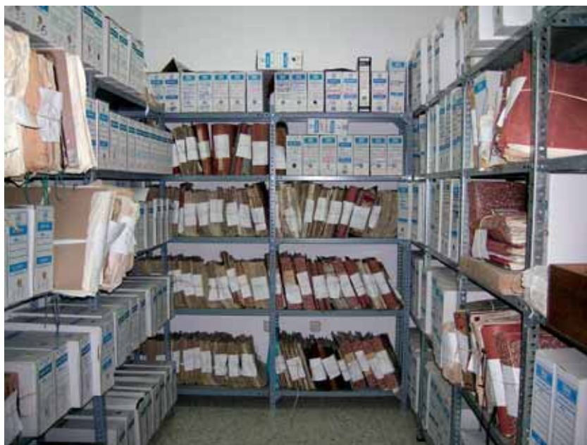
Archivo Municipal de Berlanga antes de la elaboración del Inventario.