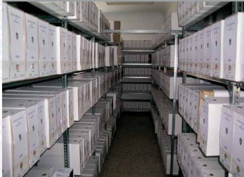
Archivo Municipal de Berlanga después de elaborar el Inventario.