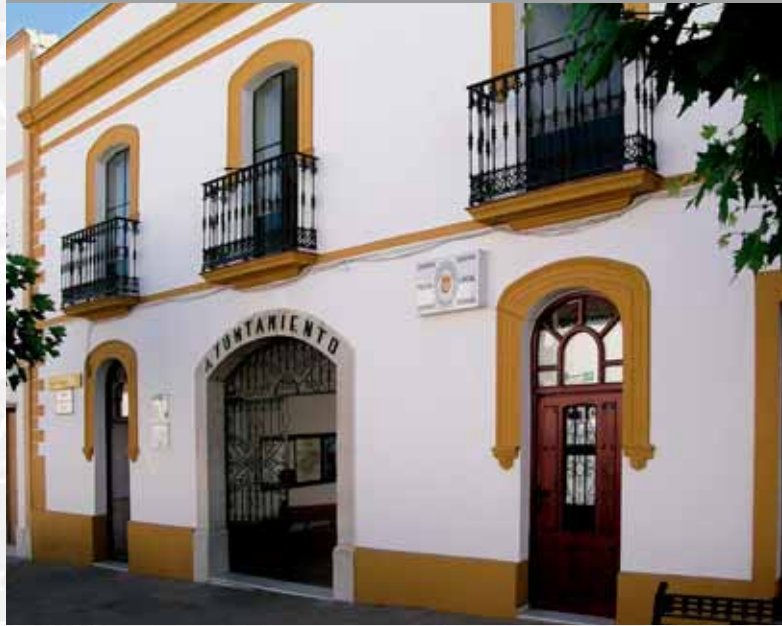
Fachada del Ayuntamiento.

STREMADURA Por Lopez año de 1706. Vieja, lucia, y por el Occ incia del Reyro de orte a Sur, 52, 100 Oeste por lo mas a entida en esta Pro- Rios Top, y Guadiana, viesan por en medio y chicos, que son el demon y el stradilla & Badajoz La, Capital de la Provin Obispado, y un Puente sobre diana, edificado por los Ala de Guerra, y tiene Castillos, el uno del O rugal, y del otro lado erro esta el fuerte de S. Merida, y en esta Augu- nto tiempo habia de la antigua situada sobre el Rio Guadiana.