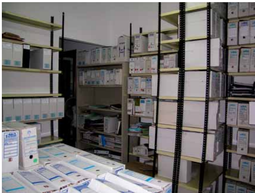
Archivo Municipal de Monesterio antes de la elaboración del Inventario.