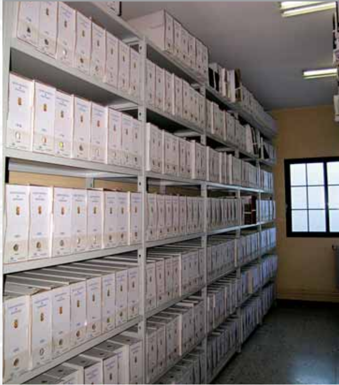
Archivo Municipal de Monesterio después de elaborar el Inventario.